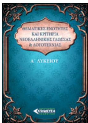
Συγγραφείς: Πέννη Παρνασσά, Βιολέττα Κοσκινά Σελίδες: 151