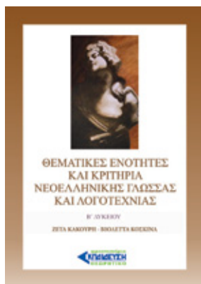
Συγγραφείς: Ζέτα Κακούρη, Βιολέττα Κοσκινά Σελίδες: 308