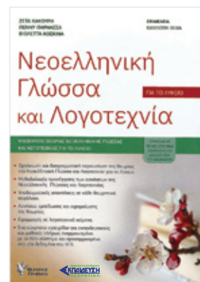
Συγγραφείς: Ζέτα Κακούρη, Πέννη Παρνασσά, Βιολέττα Κοσκινά Σελίδες: 575